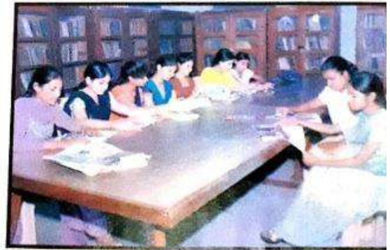
ਫਰੀ ਪੀਰੀਅਡ ਦੌਰਾਨ ਵਿਦਿਆਰਥੀ ਲਾਇਬ੍ਰੇਰੀ ਵਿੱਚ ਪੜ੍ਹਦੇ ਹੋਏ।