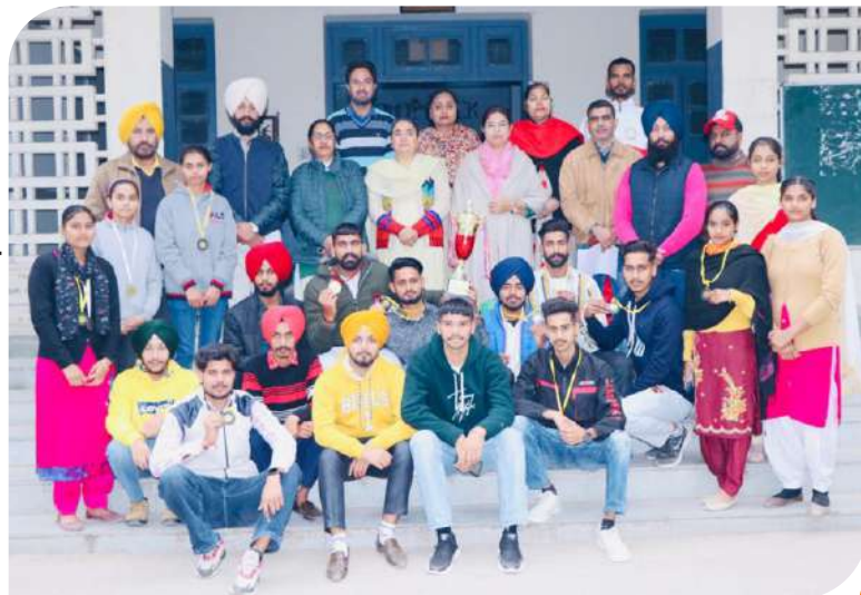
ਪੰਜਾਬੀ ਯੂਨੀਵਰਸਿਟੀ ਪਟਿਆਲਾ ਦੇ ਅੰਤਰ ਕਾਲਜ ਮਾਰਸ਼ਲ ਆਰਟ ਦੇ ਖੇਡ ਮੁਕਾਬਲਿਆਂ ਵਿੱਚ ਓਵਰ ਆਲ ਟਰਾਫੀ ਜੇਤੂ ਟੀਮ