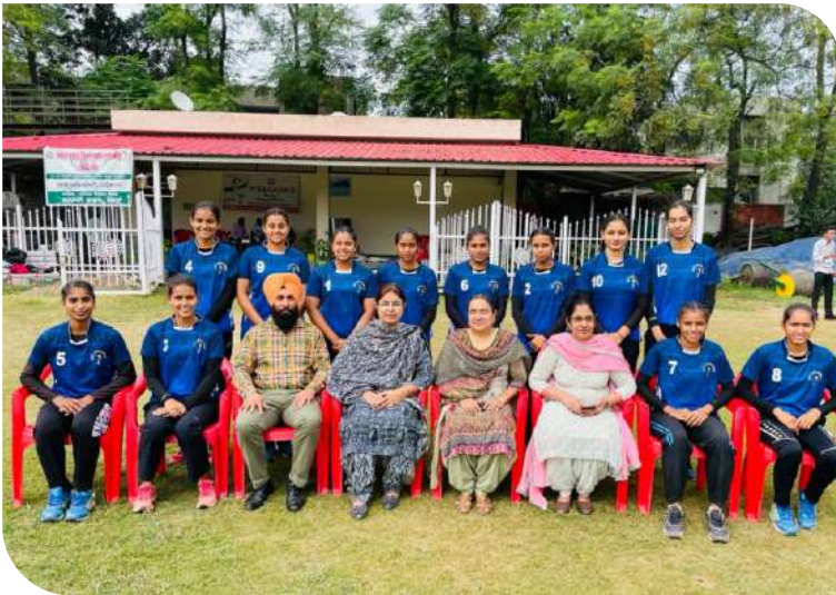
ਪੰਜਾਬੀ ਯੂਨੀਵਰਸਿਟੀ ਪਟਿਆਲਾ ਦੇ ਅੰਤਰ ਕਾਲਜ ਹੈਂਡਬਾਲ (ਲੜਕੀਆਂ) ਦੇ ਖੇਡ ਮੁਕਾਬਲਿਆਂ ਵਿੱਚ ਦੂਜੇ ਸਥਾਨ ਤੇ ਰਹੀ ਟੀਮ